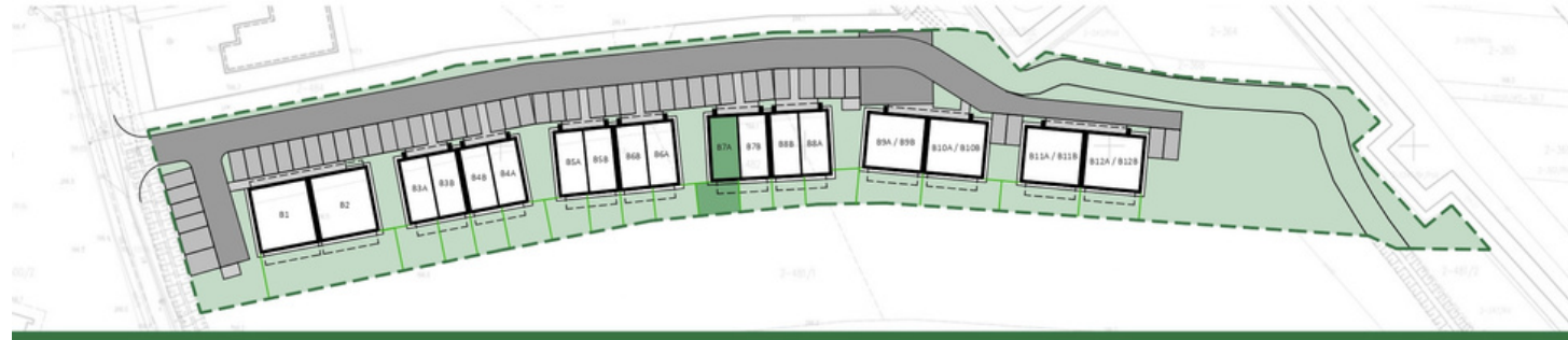
RZUT PARTERU |